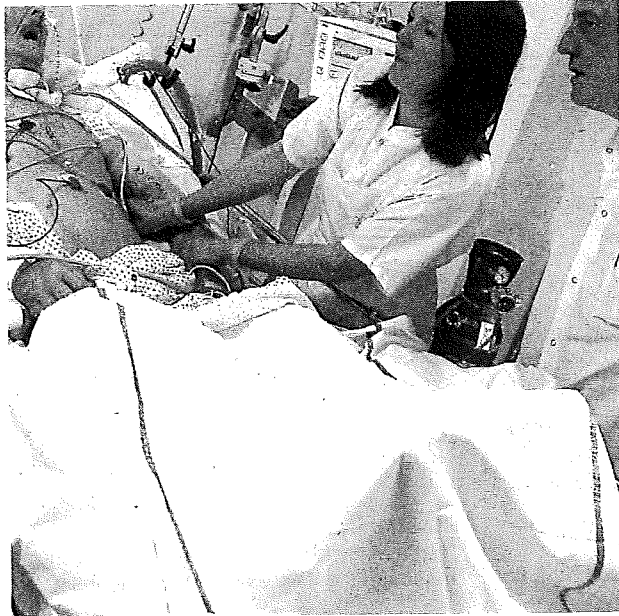
Chaque année, près de 12 000 résidents luxembourgeois obtiennent une autorisation pour se faire soigner à l'étranger.

Des soins chez un dentiste à Thionville, une opération à Trèves ou le passage aux urgences pendant ses vacances en Espagne. Après le temps des soins, vient celui du remboursement par la Caisse nationale de santé (CNS) pour les résidents, et c'est à ce moment-là que l'assuré se retrouve face aux détails d'une réglementation mal connue. Ouf, une nouvelle brochure va maintenant les guider! «Car en s'informant sur quelques règles de base, on peut éviter de rester sur ses frais», note Nico Hoffmann, de l'Union