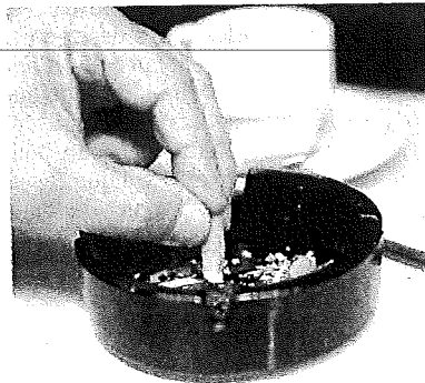
Les cigarettes seront bannies des cafés et coûteront plus cher.

LUXEMBOURG - Les cafetiers et autres tenanciers de bar n'auront pas le choix: leurs établissements passeront bel et bien non-fumeurs. «Ce serait contre-productif que de leur laisser le choix», explique le ministre socialiste de la Santé, Mars Di Bartolomeo. Qui veut présenter un plan antitabac avant fin 2010 «pour protéger les non-fumeurs». «Le chemin est tracé dans le plan de gouvernement et je ne ferai que l'appliquer», martèle le ministre. Plus de cigarettes au bistrot, donc, mais pas seulement. Le plan, qui reste à finaliser et adopter, proposera également une hausse des prix du tabac.